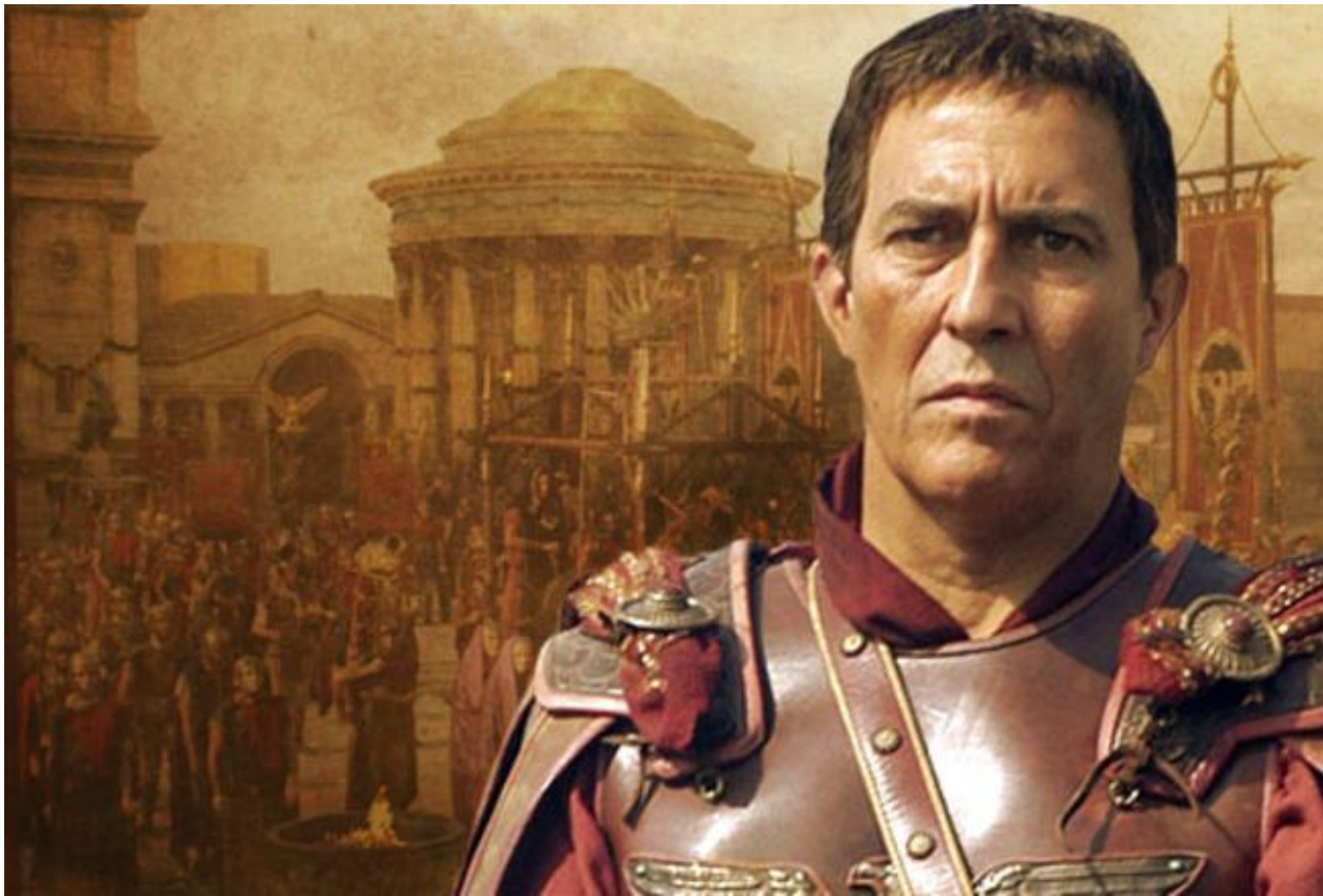
Гай Юлій Цезарь

Риторика сприяє вивченню курсу філософії, який навчає системності мислення, мовлення і поведінки. Окремі філософські дисципліни – етика, естетика, логіка – знайомлять з цінностями моралі, принципами розуміння прекрасного, законами мислення.