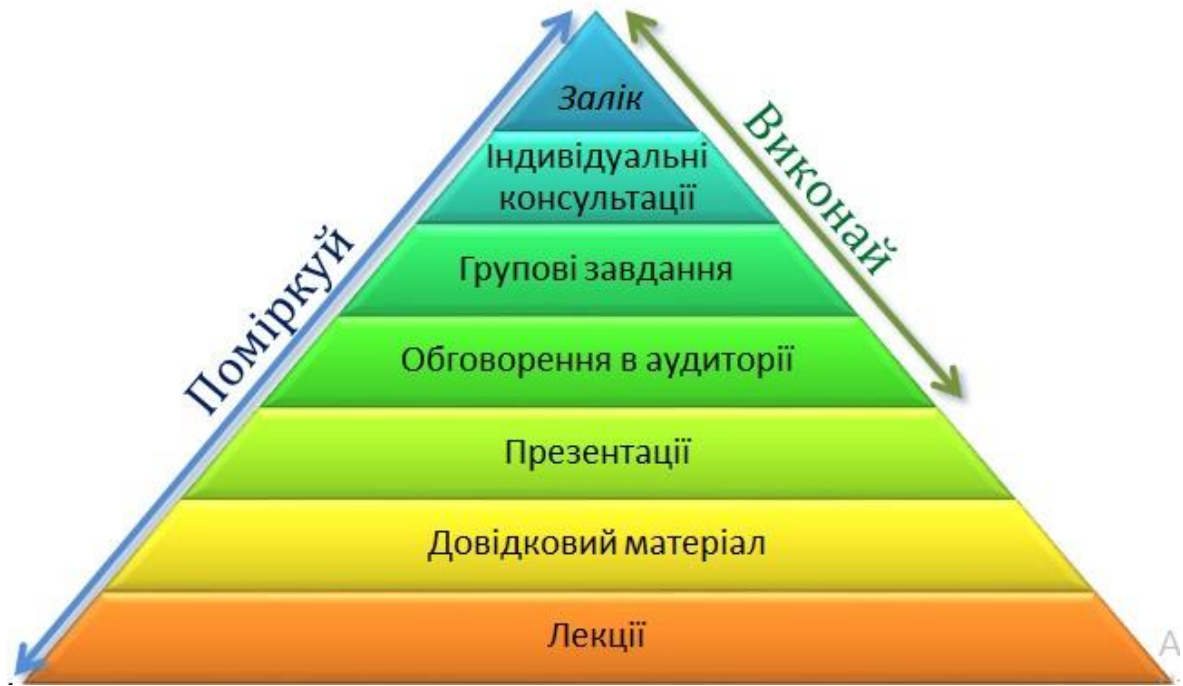
Організація інтермодальних перевезень / схема курсу

Практичні заняття курсу передбачають виконання індивідуальних завдань з організації інтермодальних перевезень. Виконання завдання супроводжується зануренням у суміжні дисципліни, що доповнюють теми, та формують у студента інформаційну та комунікативну компетентності.