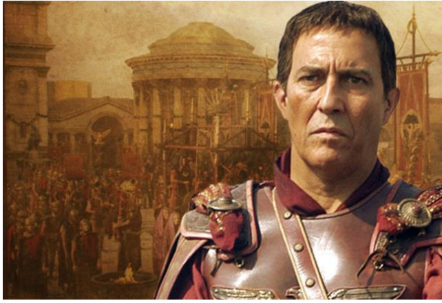
Гай Юлій Цезарь

Риторика сприяє вивченню курсу філософії, який навчає системності мислення, мовлення і поведінки. Окремі філософські дисципліни – етика, естетика, логіка – знайомлять з цінностями моралі, принципами розуміння прекрасного, законами мислення.