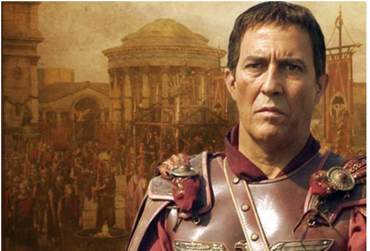
Гай Юлій Цезарь

Риторика сприяє вивченню курсу філософії, який навчає системності мислення, мовлення і поведінки. Окремі філософські дисципліни – етика, естетика, логіка – знайомлять з цінностями моралі, принципами розуміння прекрасного, законами мислення.